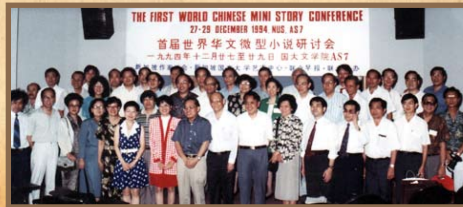
1994年12月首屆世界華文微型小說研討會全體合照。