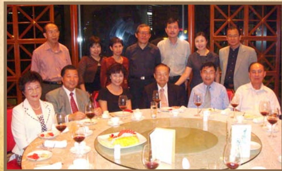
2007年7月，金庸（前右3）宴请新加坡作家与中国作协主席铁凝（前右4）等嘉宾。