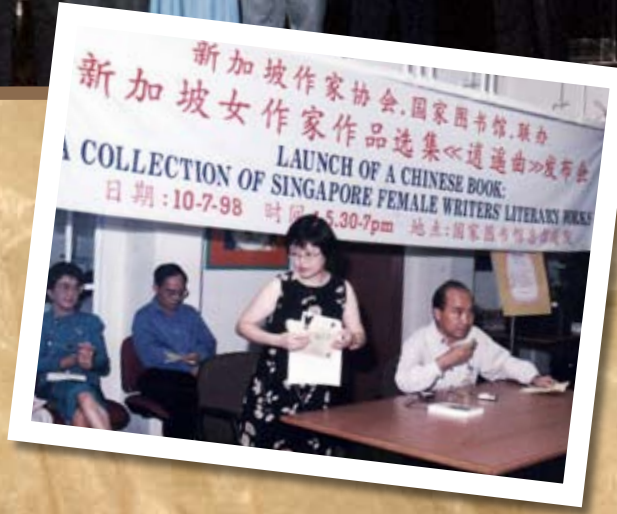
1998年作协与国家图书馆 联办新加坡女作家作品选 逍遥曲发布会。