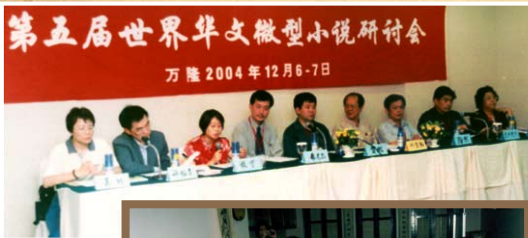
2004年12月，作協代表出席在萬隆舉行的第5屆世界華文微型小說研討會。