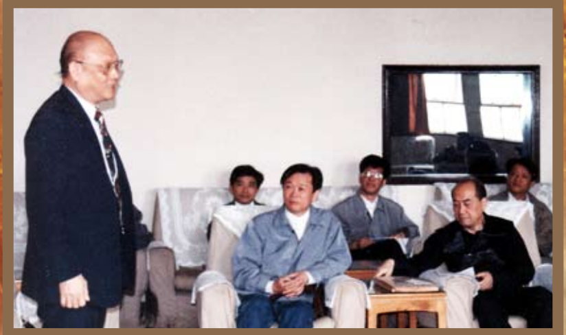
1996年与江苏作协交流照。