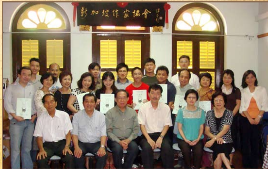
2009年6月，文学讲习班结业礼，学员与讲师及作协理事合影。