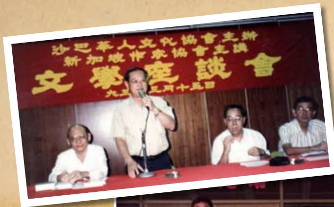
1993年沙巴華人文化協會 與作協聯辦文學座談會。