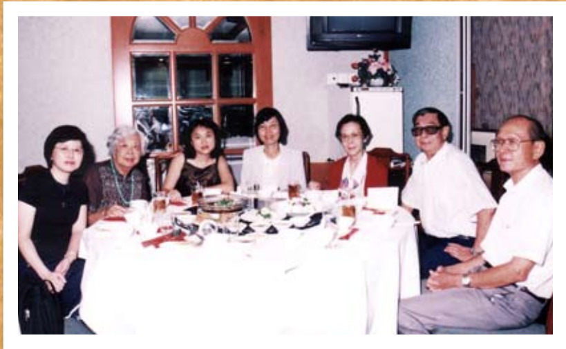
2000年作协常年会员大会。