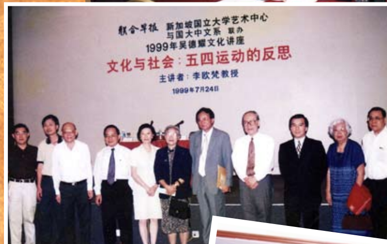
1999年文化与社会五四 运动的反思讲座。