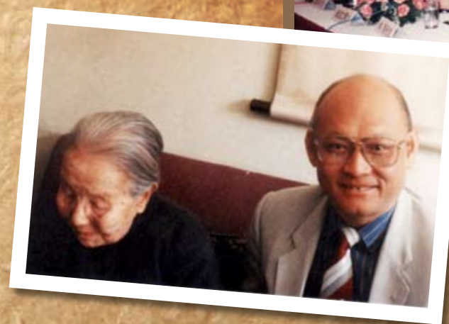
1993年黄孟文与冰心合影。