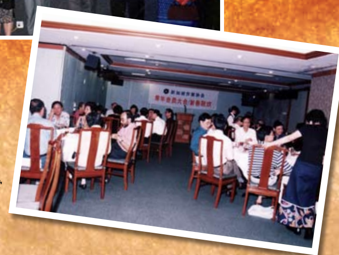
2000年作协常 年会员大会。