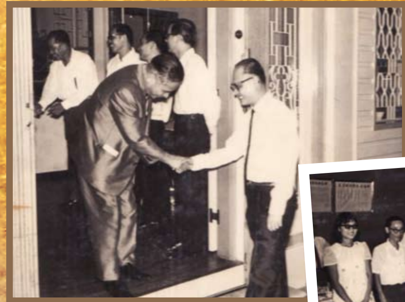
早期作协活动照之二。