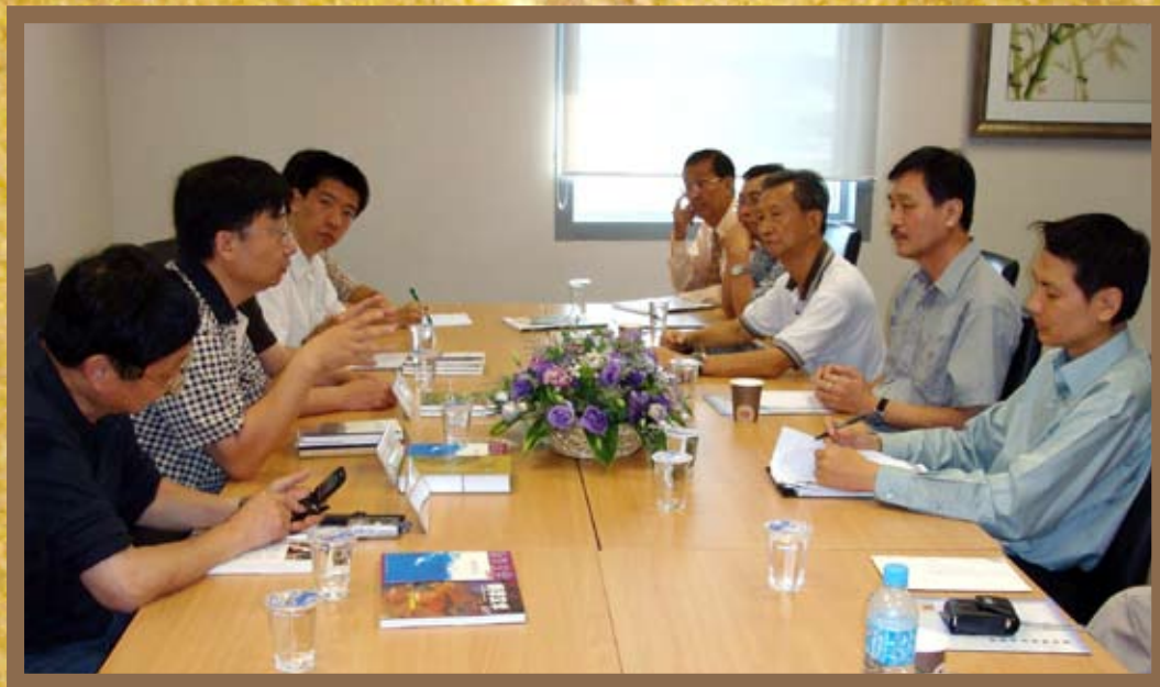
2008年4月,中国诗人来访,与作协代表进行交流。