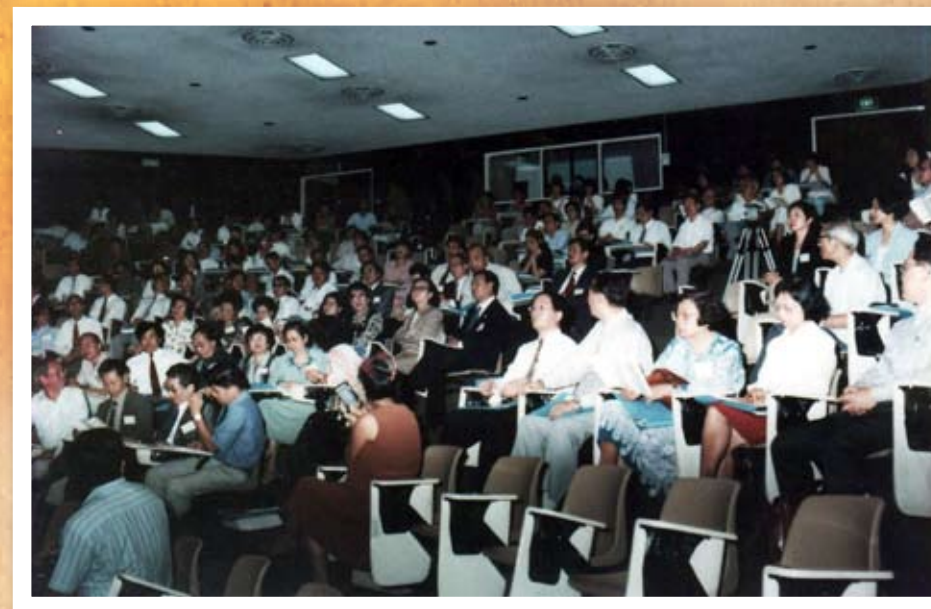
1994年12月首屆世界華文微型小說研討會現場。