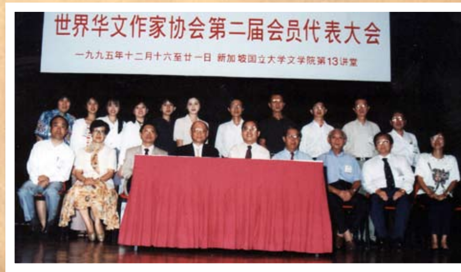
1995年12月，世界华文作家协会第二届会员代表大会合照。