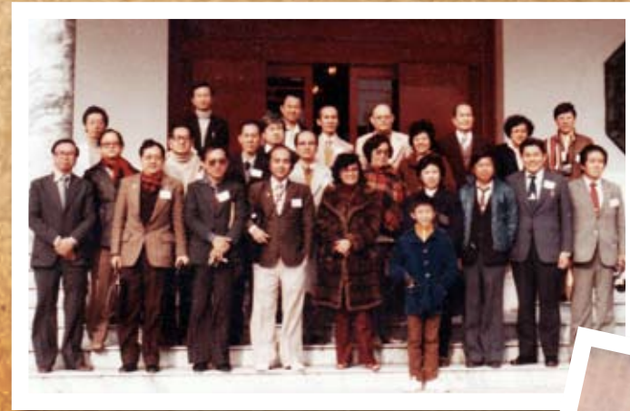
1981年台北第一届亚洲华文作家会议。