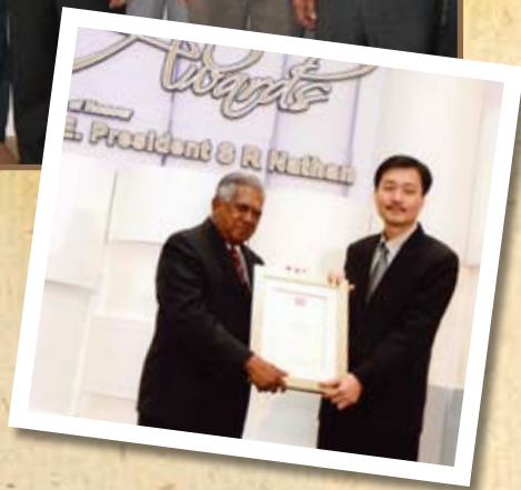
2008年10月，我国总统纳丹颁发文化奖予希尼尔。