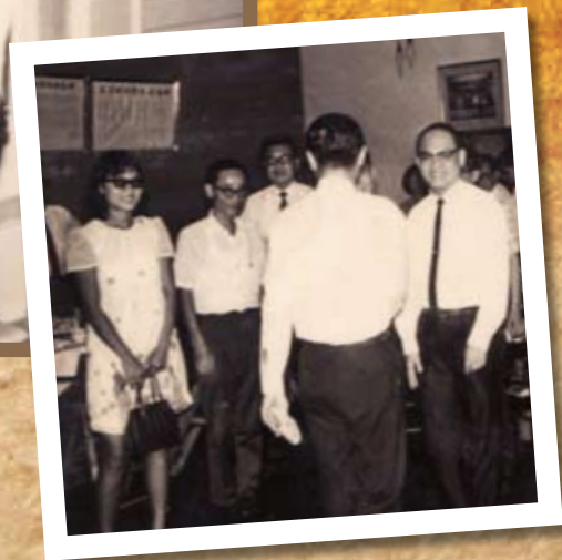
早期作协活动照之三。