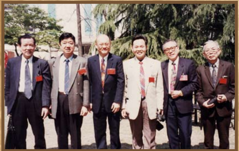
1996年与江苏作协交流照。