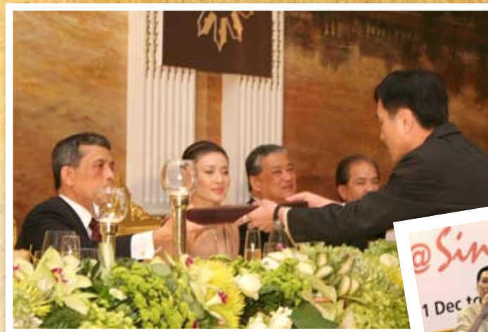
2009年10月，希尼尔获颁东南亚文学奖，从泰国王储玛哈·哇集拉隆功殿下接受此份殊荣。