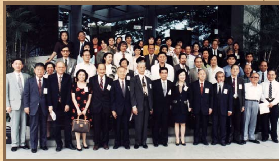
1995年12月，世界华文作家协会第二届会员代表大会暨新加坡作协25周年会员大会同时举行。