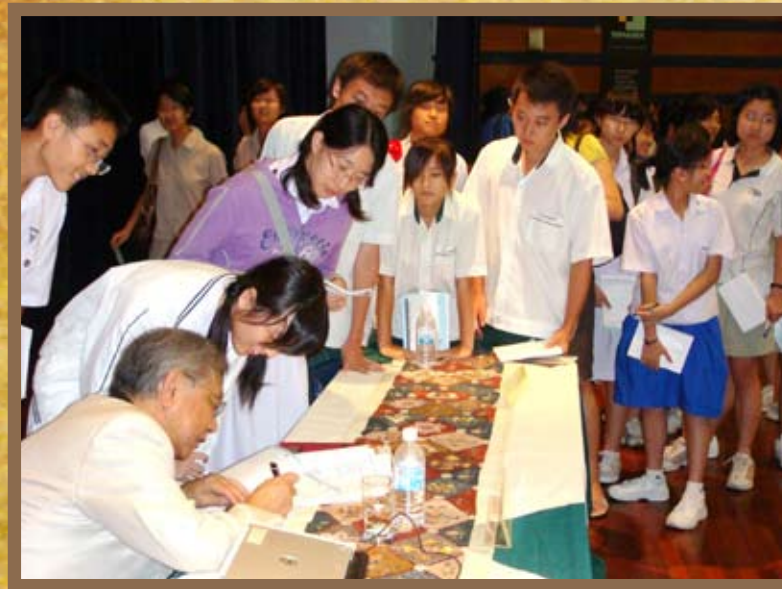
2008年4月,作协与推广华文学委员会联办“文学四月天”讲座,诗人郑愁予现场为年轻的文学粉丝签名。