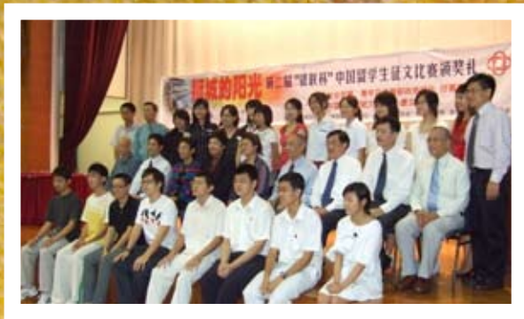
2008年3月,《狮城的阳光》——银联杯中国留学生征文比赛颁奖典礼。政务部长符喜泉女士(中排右6)与评审及获奖同学合影。