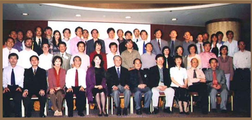
2003年，东南亚华文文学国际学术研讨会会议现场。