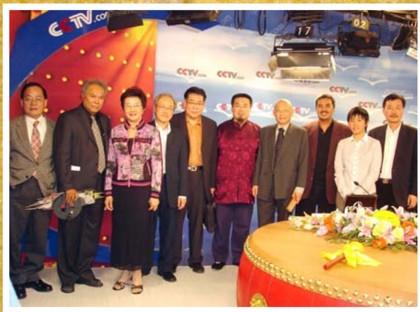
2007年10月，新加坡作家代表参与《新加坡节》在中国的文化项目，在CCTV的摄影棚内，录制文学对话的节目。