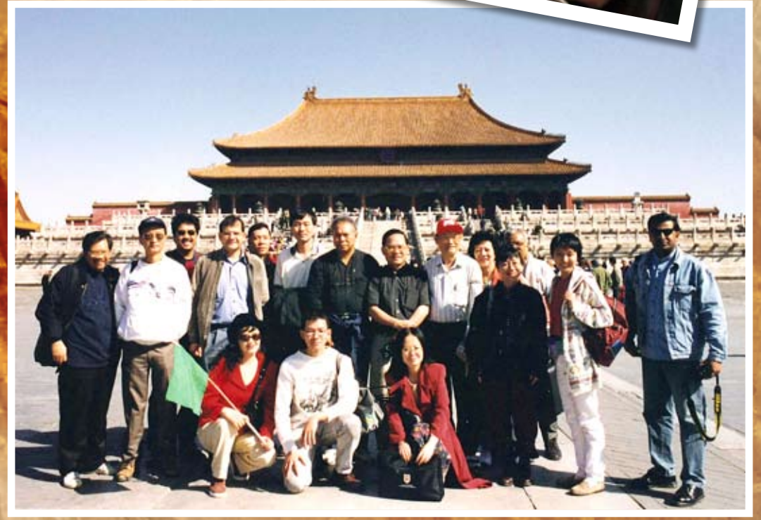
1999年，四大语言源流作家访问中国，访问团在紫禁城留下足迹。